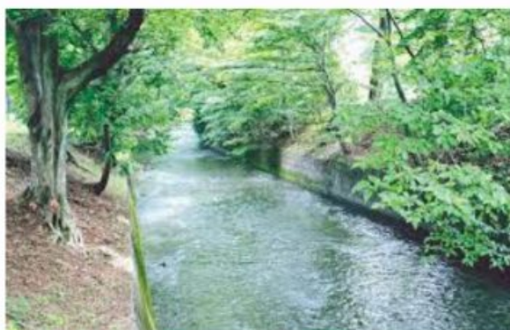
玉川上水 昭島市内→昭島市

さてここからは、生まれも育ちも昭島市の私の身の回りのことを中心に述べさせていただきます。