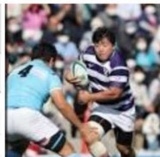
対筑波大 突進の猛攻撃