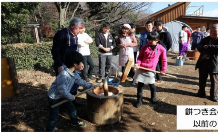
餅つき会の写真は 以前のものです