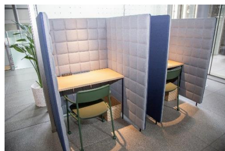
個別に仕切られた自習スペース (駿河台キャンパス)