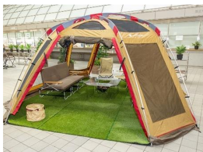
スノーピーク寄贈のキャンプ用品 (生田キャンパス)

明治大学では、ニューノーマル時代にふさわしい学修環境の整備を進めています。中野キャンパス(2013年4月開設)に続き、和泉ラーニングスクエア(2022年3月竣工)など新しい校舎が増えている一方で、既存の建物でも、オンライン授業を受けやすい個別ブースやアクティブラーニングに取り組む学生の交流スペースを新たに設けるなどリニューアルを図っています。